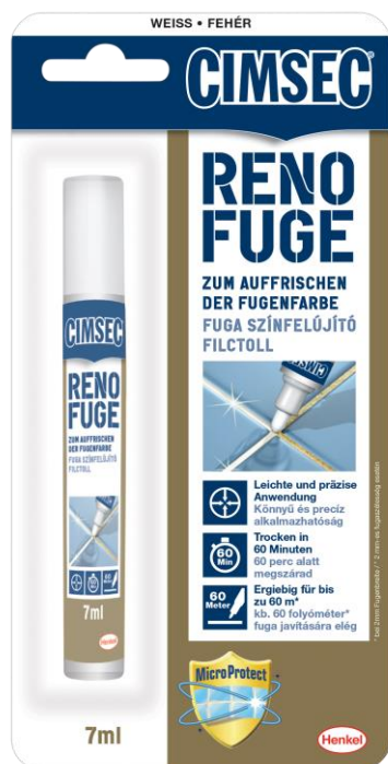
LIEFERFORM: 7 ml Fugenstift auf Blisterkarte